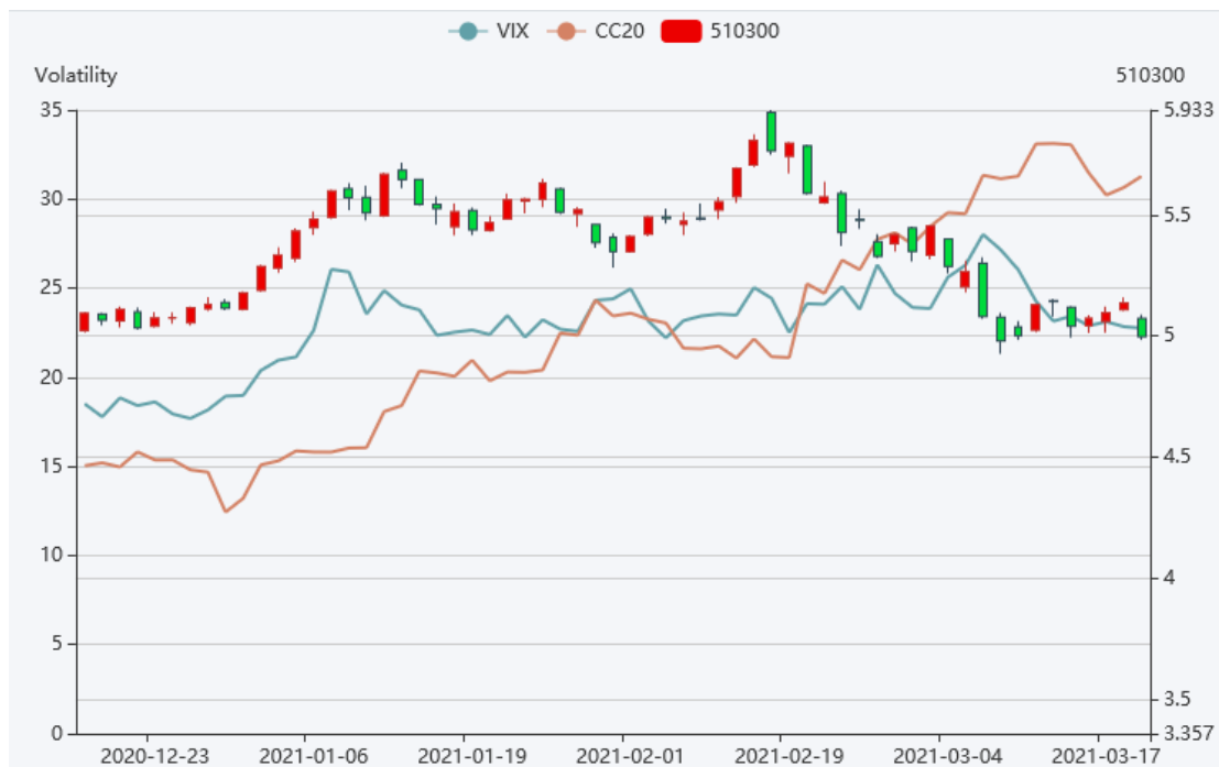
图 3 波动率指数

从各类因子的表现来看，上周各类因子超额收益一般，市场维持小市值风格。从市场波动率来看，市场进入震荡期后，波动率快速下行，短期风险已经释放比较充分。